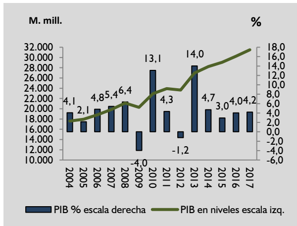
Gráfico N°I Producto Interno Bruto (PIB) En niveles y crecimiento real