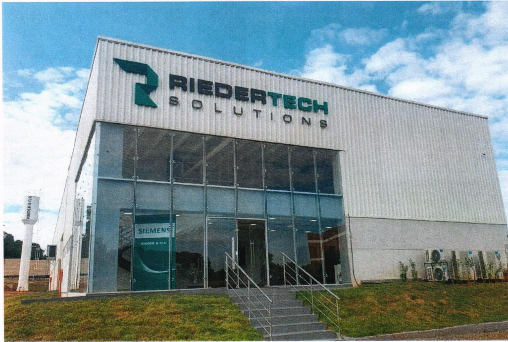
Fábrica de Tableros eléctricos con tecnología SIEMENS, Ciudad del Este - PY