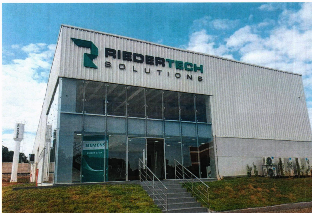
Fábrica de Tableros eléctricos con tecnología SIEMENS, Ciudad del Este - PY