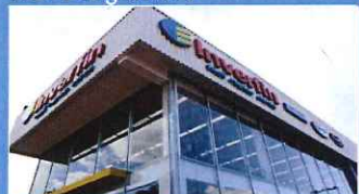
Ciudad del Este