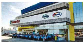
Sucursales Premium Ypacarai